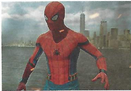
Grosses Kräftemessen: «Spider-Man».

an: Homecoming — Peter Parker (land), ein 15-jähriger Pennäler, hat n Mentor Tony Stark (Robert Dowas Handwerk der Superhelden ge allem das des Spider-Man. Grosse sollte er trotzdem noch vermeiden. ker, der Kalle Blomquist unter den den, hält sich natürlich nicht dran gleich das grosse Kräftemessen. Sein