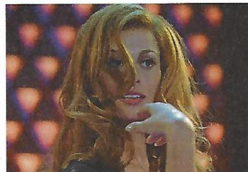
In fast allen Sprachen: «Dalida».